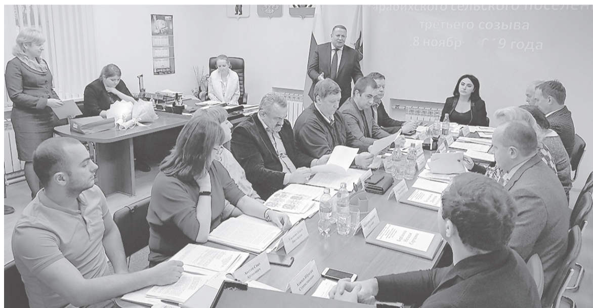
Заседание Муниципального совета Карабихского СП третьего созыва

Местное самоуправление – форма осуществления власти народом. Оно дает гражданам возможность участвовать в решении социально-экономических вопросов территории, проявлять общественные инициативы и отстаивать интересы. На практике это реализуется через участие в публичных слушаниях, собраниях, население действует через своих представителей – депутатов.