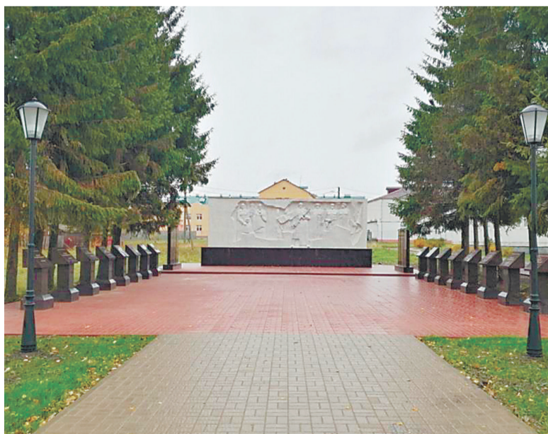
Аллея героев в селе Туношна

► По направлению «Поддержка местных инициатив» в районе за год будет реализовано 14 проектов на общую сумму более 10,82 миллиона рублей.