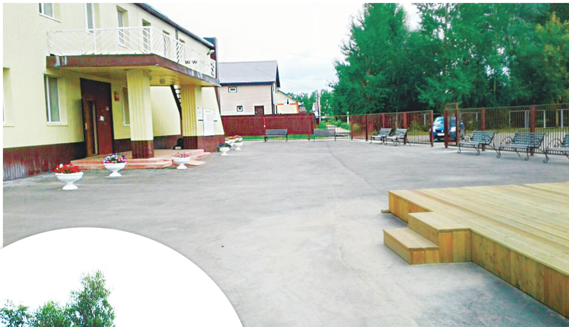
Ремонт площади у ДК села Сарафоновна