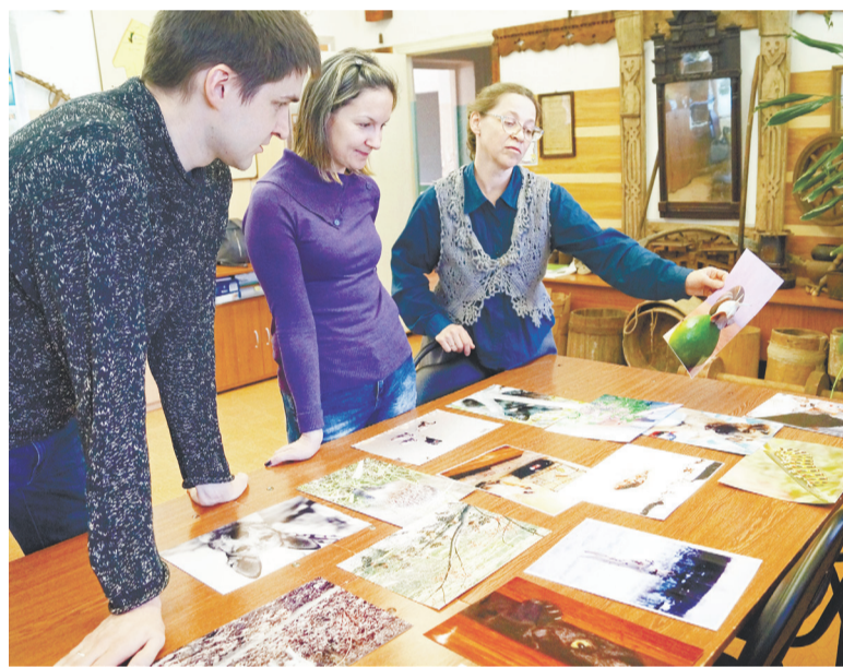
Жюри за работой