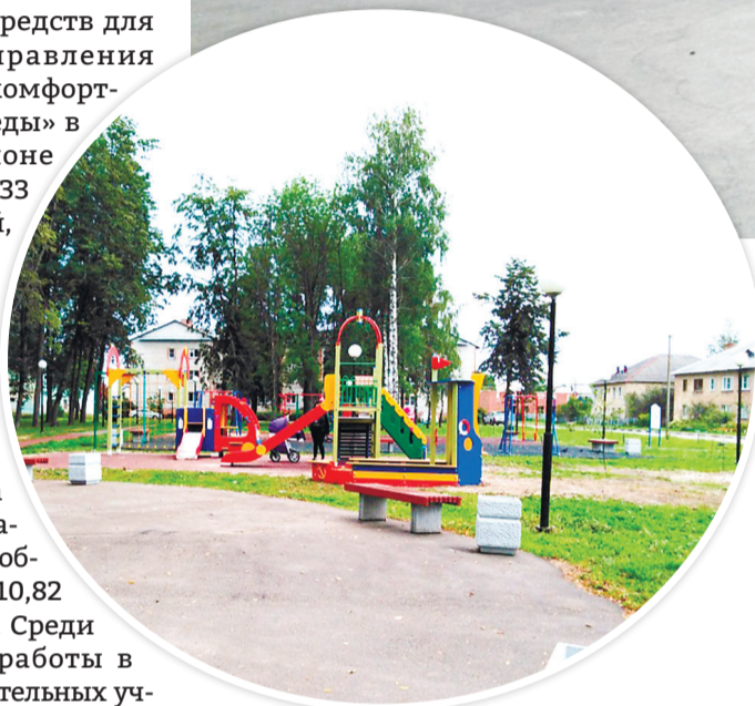
Благоустройство парка в поселке Дубки

Постановлением администрации Ярославского района утвержден состав муниципальной общественной комиссии по реализации проекта «Решаем вместе!». Среди ее задач – контроль выполнения проектов инициативного бюджетирования, приемка результатов работы. Для этого, с учетом складывающейся на территории санитарно-эпидемиологической ситуации, запланированы комиссионные выезды на объекты и встречи с жителями. Инициативные группы граждан, в рамках действующего законодательства, сами составляют приоритеты в расходовании бюджетных средств, выдвигают инициативы и контролируют их реализацию.