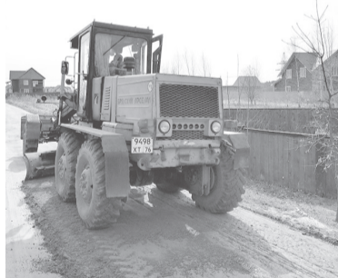
8 апреля проведено грейдирование улиц в деревне Карабиха (ул. Рябиновая, Софийская, Цветочная) и проезда Октября в поселке Красные Ткачи

Одно из ключевых звеньев местного самоуправления – Муниципальный совет Карабихского сельского поселения третьего созыва, избранный 8 сентября 2019 года. Он контролирует бюджет, чтобы обеспечить стабильное финансирование всех принятых муниципальных программ, достичь равномерного и полного исполнения финансового документа, как по доходной, так и по расходной части. Осуществление нормотворческой деятельности в соответствии с полномочиями, прописанными в федеральном и региональном законодательстве, в муниципальной нормативно-правовой базе – одна из основ-