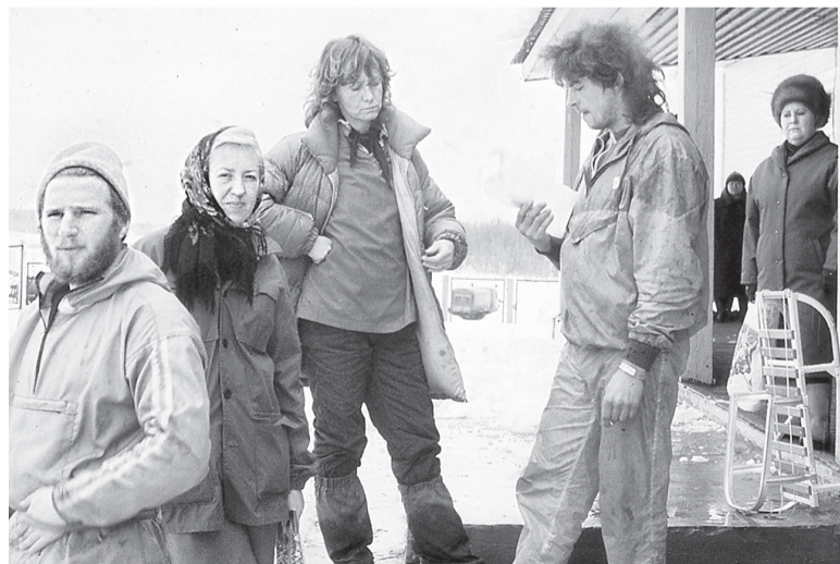
Ярославцы на Соловках

ховный подвиг на Соловках. Глубоко почитаемы имена основателей монастыря преподобных Зосимы, Савватия и Германа, Анзерских чудотворцев Елеазара и Иова, а также святителя Филиппа, митрополита Московского и всея Руси, который, почти 30 лет прожив в Соловецком монастыре, 18 из них – в качестве настоятеля, много сделал для его укрепления и процветания. Став митрополитом, святитель Филипп смело выступил против злодеяний опричнины и принял мученическую кончину. Из соловецких постриженников вышли два патриарха – Иоасаф I