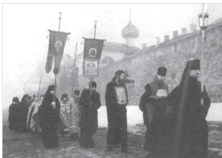
Крестный ход. Далекая история

(1634–1641) и Никон (1652–1658), шесть митрополитов, несколько архиепископов и епископов, множество подвижников, прославившихся святостью и чудотворениями.