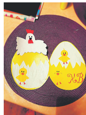
Автор поделки – Артём Смирнов